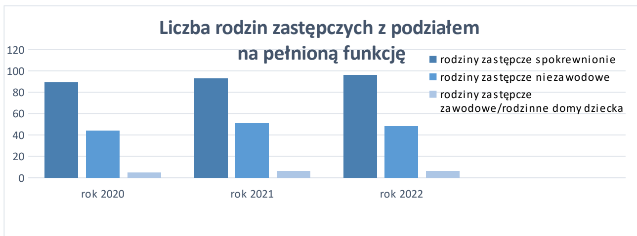
Wykres 1. Liczba rodzin zastępczych w latach 2020 – 2022 (stan na 31 grudnia każdego roku)