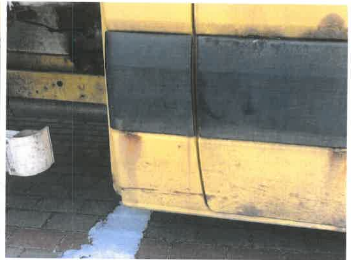
Fot. 24 IMG_4376