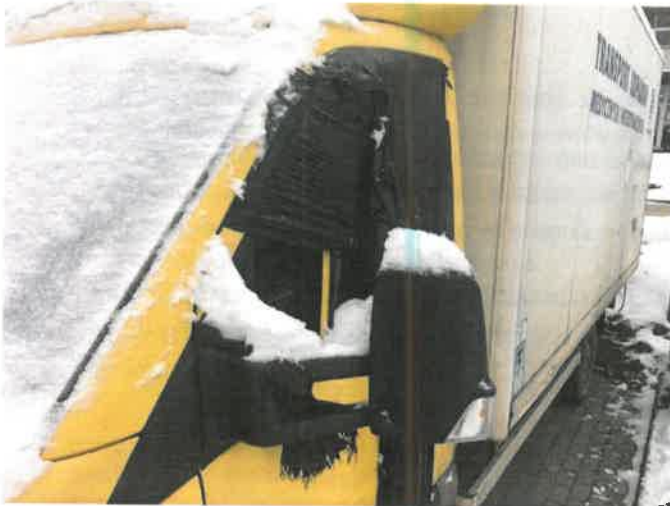
Fot. 7 IMG_4359