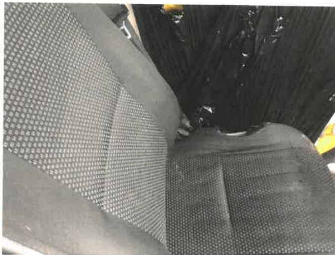
Fot. 12 IMG_4364