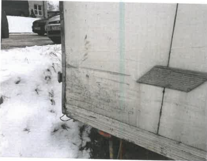
Fot. 17 IMG_4369