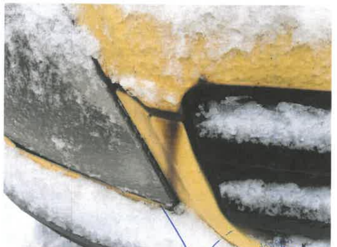
Fot. 28 IMG_4380

Biuro Rzeczoznawstwa Samochodowego Ruchu Drogowego, Wyceny Maszyn i Urządzeń inż. Mirosław Kołomański 83-200 Starogard Gdański NIP 5921393985