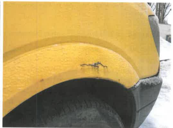
Fot. 26 IMG_4378