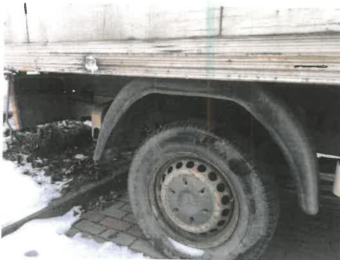
Fot. 21 IMG_4373