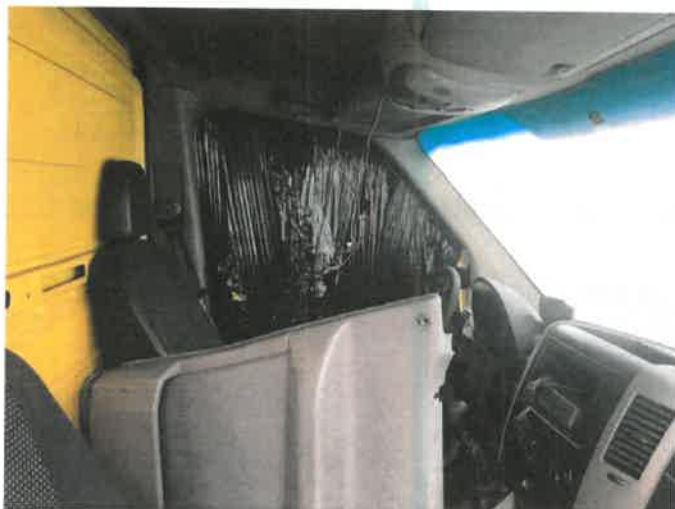
Fot. 9 IMG_4361