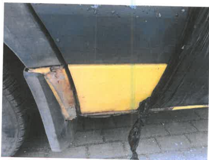
Fot. 45 IMG_4408