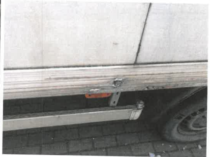
Fot. 36 IMG_4388