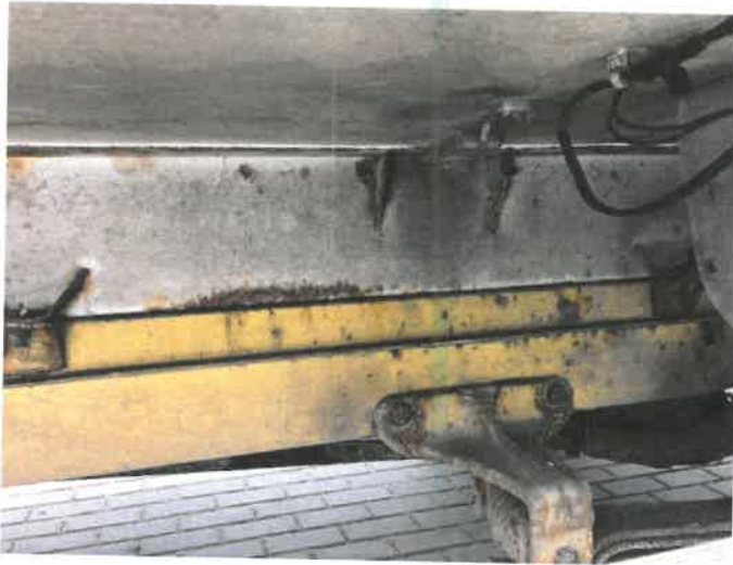
Fot. 35 IMG_4387