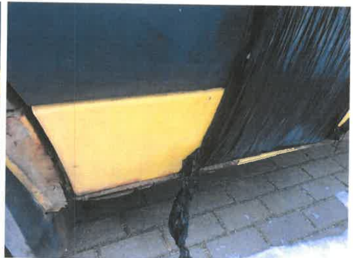
Fot. 32 IMG_4384