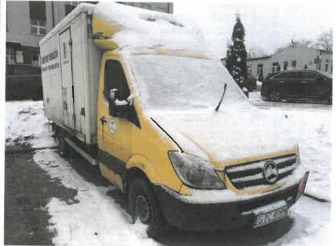
Fot. 2 IMG_4354