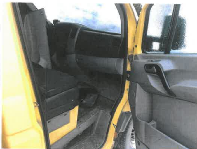
Fot. 16 IMG_4368