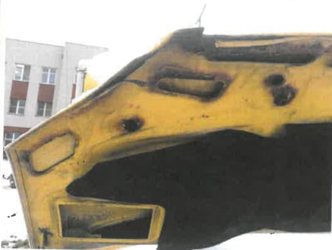
Fot. 42 IMG_4395