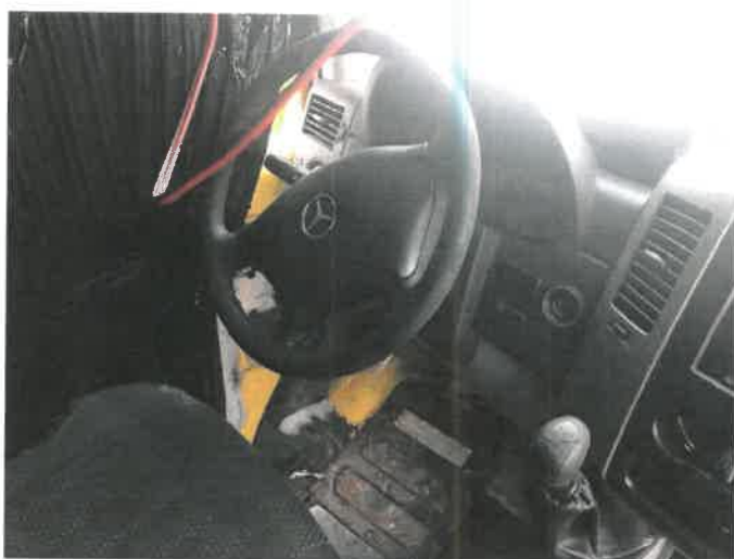
Fot. 13 IMG_4365