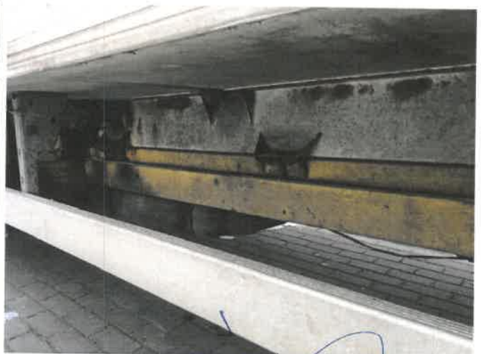
Fot. 34 IMG_4386