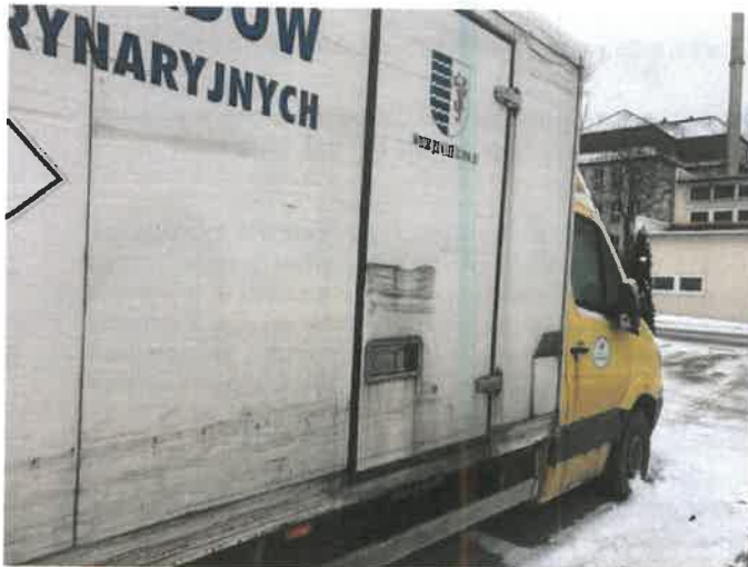
Fot. 3 IMG_4355