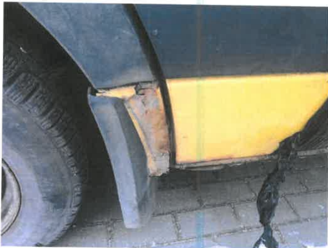
Fot. 31 IMG_4383