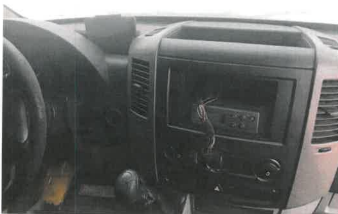
Fot. 14 IMG_4366