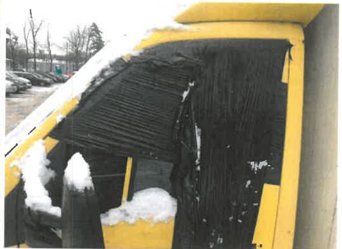
Fot. 8 IMG_4360