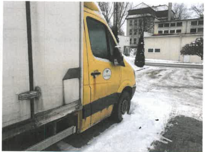
Fot. 4 IMG_4356