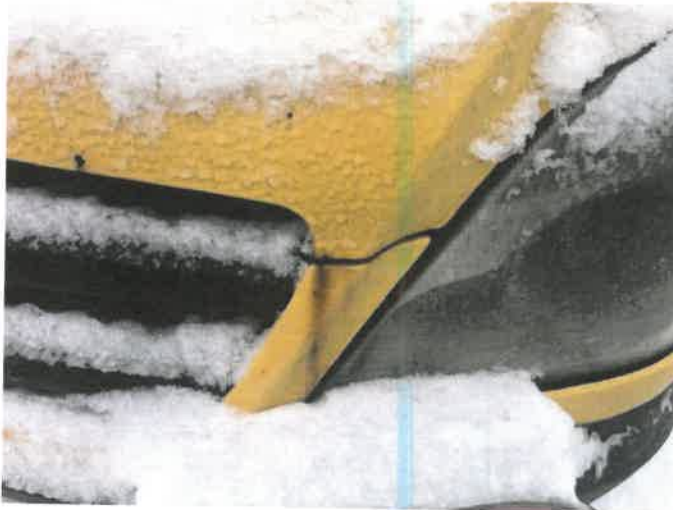
Fot. 29 IMG_4381