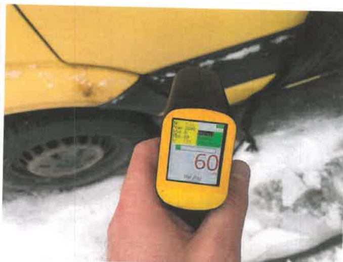
Fot. 44 IMG_4401