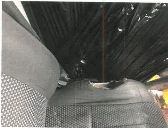
Fot. 11 IMG_4363