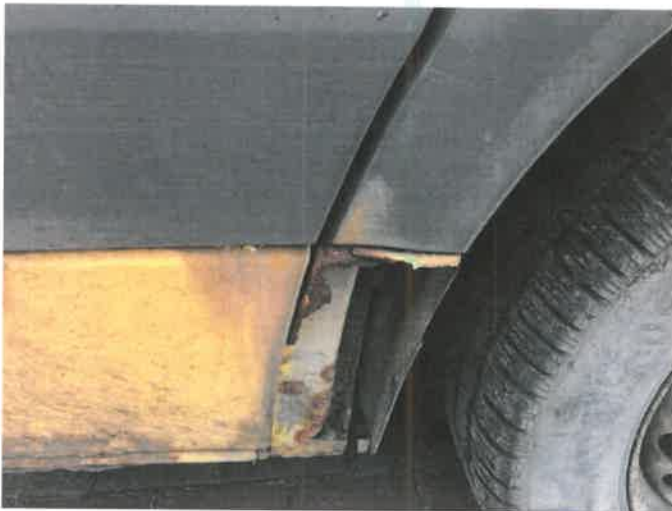
Fot. 25 IMG_4377