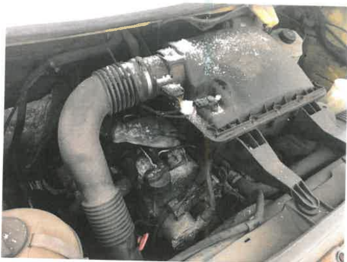
Fot. 41 IMG_4394