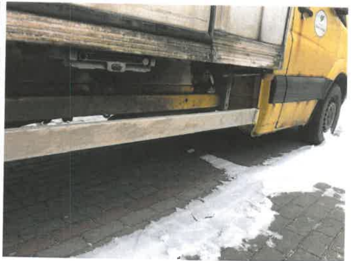
Fot. 20 IMG_4372