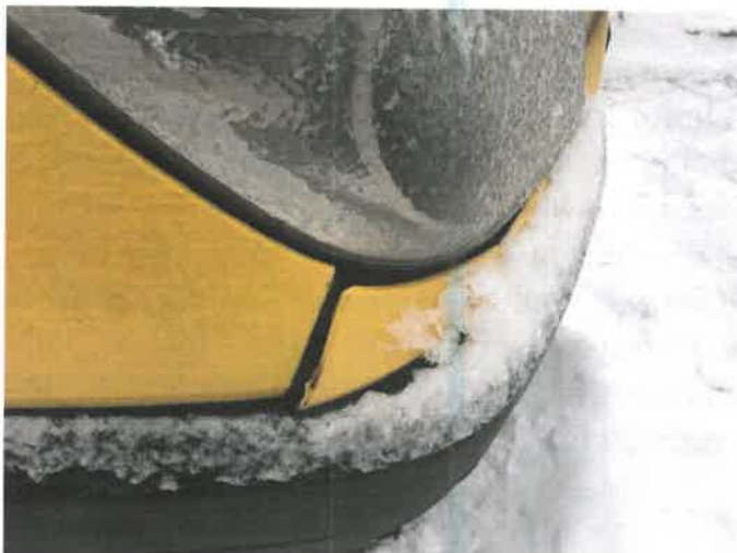
Fot. 27 IMG_4379