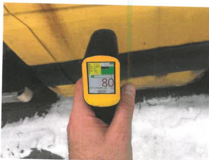
Fot. 43 IMG_4397