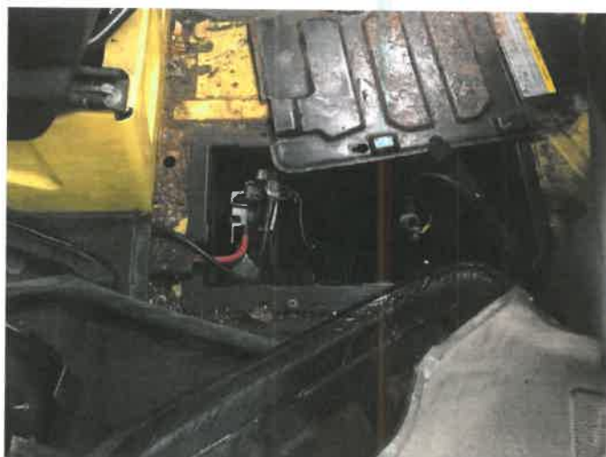
Fot. 15 IMG_4367