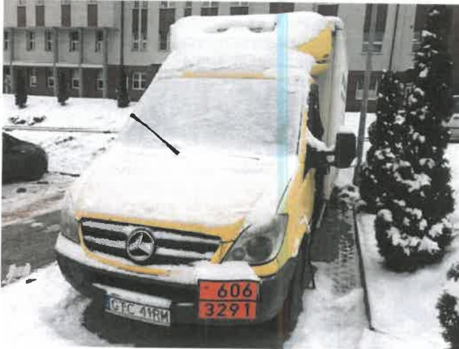
Fot. 1 IMG_4353

Rodzaj pojazdu: Samochód ciężarowy do 3.5t