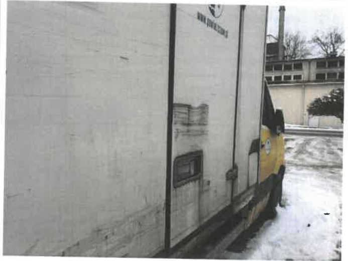
Fot. 18 IMG_4370