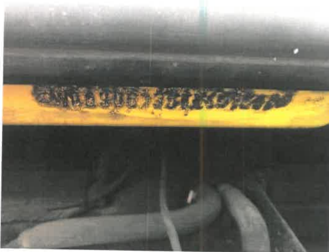
Fot. 37 IMG_4390