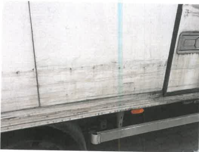
Fot. 19 IMG_4371