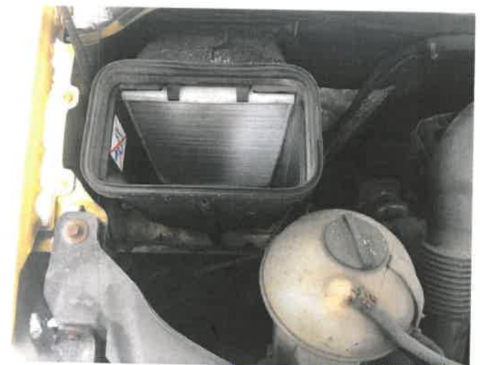
Fot. 40 IMG_4393

Biurowe Rozpoznawstwo Samochodowe Ruchu Drogowego, Wyceny Maszyn i Urządzeń inż. Mirosław Kołomański 83-200 Starogard Gdański NIP 5921333926