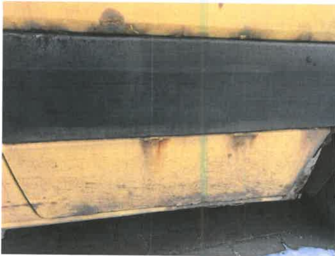
Fot. 23 IMG_4375