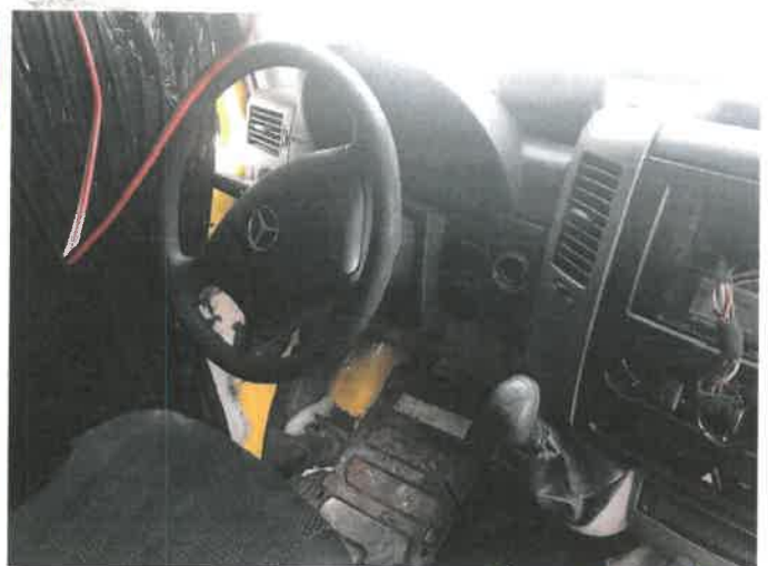
Fot. 10 IMG_4362

Biurow Rzeczoznawstwa Samochodowego Ruchu Drogowego, Wyceny Maszyn i Urządzeń inż. Mirosław Kolomański 83-200 Starogard Gdański ul. Słowackiego 105