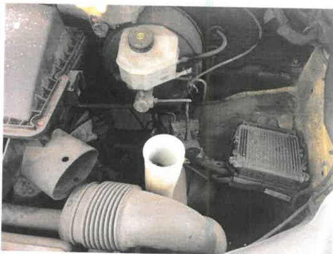
Fot. 39 IMG_4392