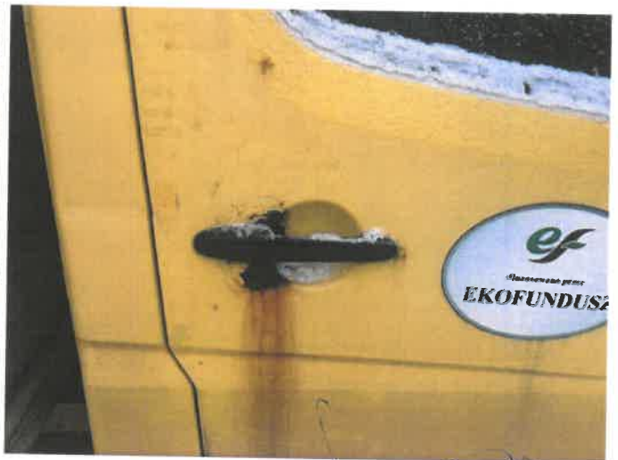
Fot. 22 IMG_4374

Biurow Rzeczoznawstwa Samochodowego Ruchu Drogowego, Wyceny Maszyn i Urządzeń inż. Mirosław Kolomański 83-200 Starogard Gdański NIP 592 75 539 76