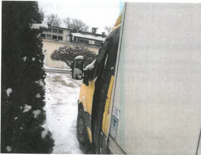
Fot. 5 IMG_4357