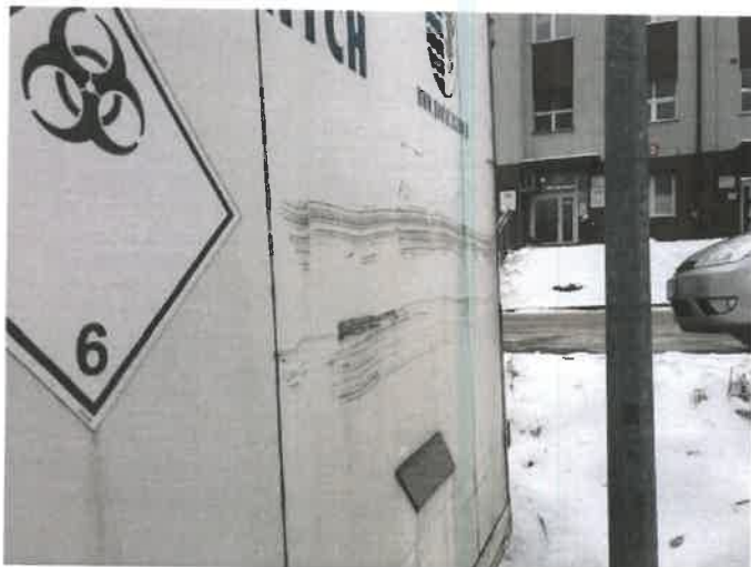
Fot. 33 IMG_4385