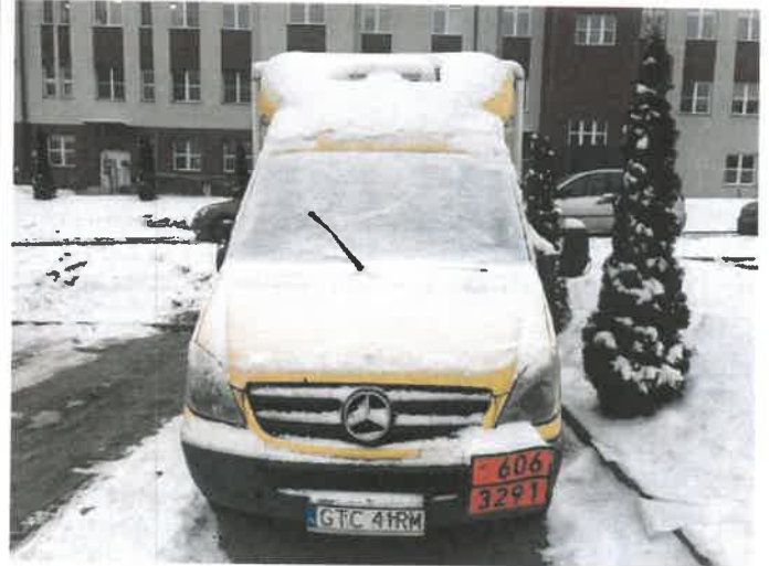
Fot. 6 IMG_4358