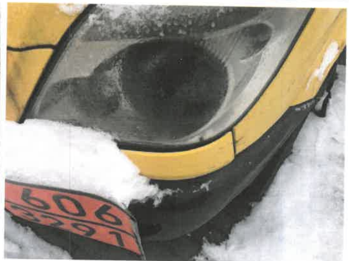
Fot. 30 IMG_4382