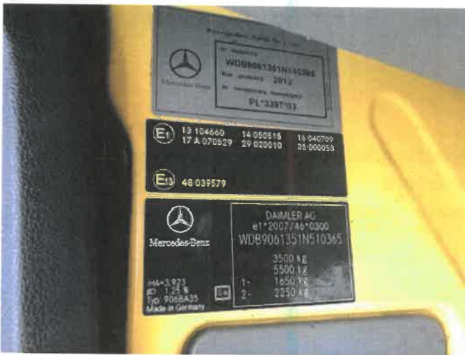
Fot. 13 IMG_4270