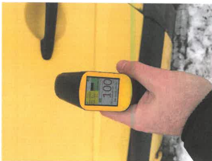
Fot. 21 IMG_4285