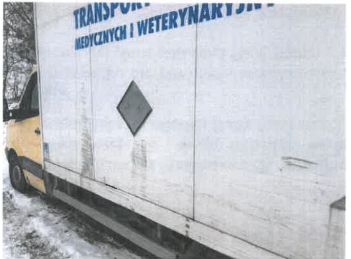
Fot. 8 IMG_4264