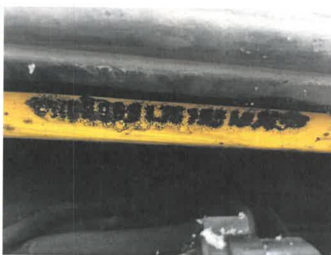
Fot. 20 IMG_4282