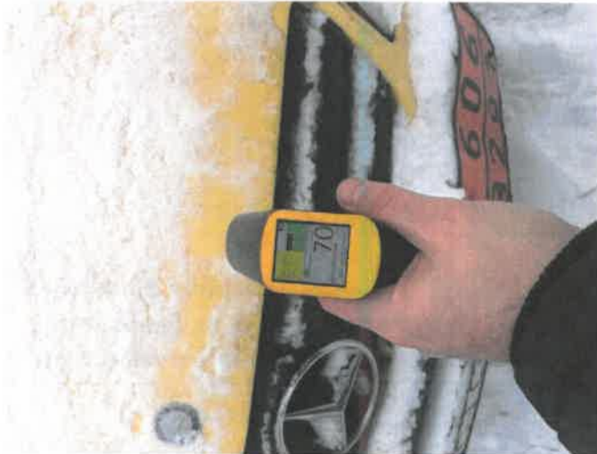
Fot. 23 IMG_4287