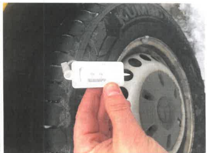
Fot. 26 IMG_4290