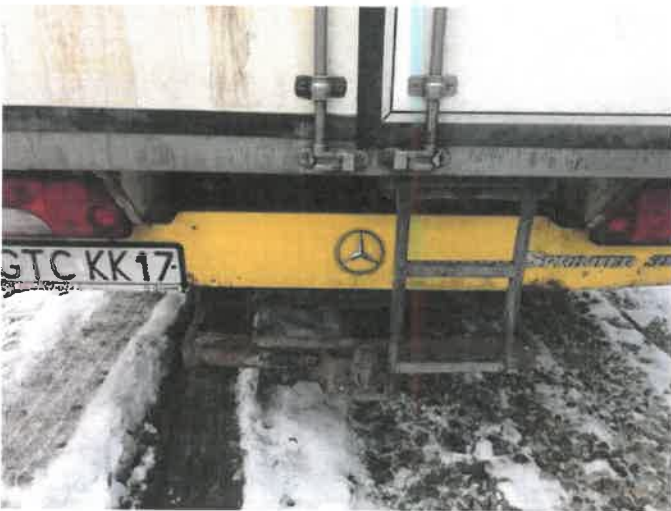
Fot. 7 IMG_4263