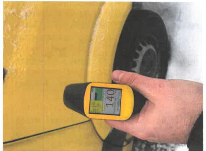
Fot. 24 IMG_4288