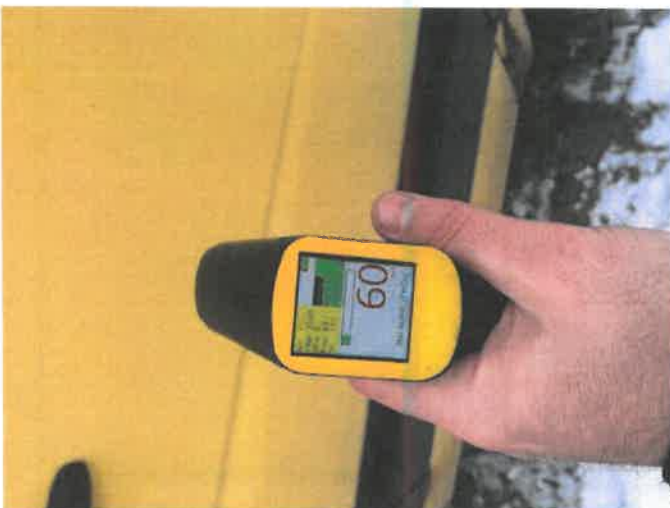
Fot. 25 IMG_4289