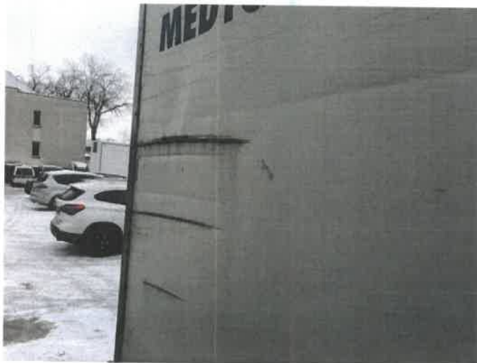
Fot. 17 IMG_4277