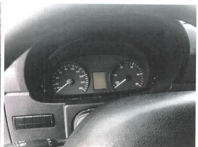
Fot. 12 IMG_4268