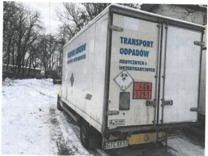
Fot. 4 IMG_4260

Biurowo Biuro Rzeczoznawstwa Samochodowego, Ruchu Drogowego, Wyceny Maszyn / Urządzeń inż. Mirosław Kołomański 63-200 Starogard Gdański