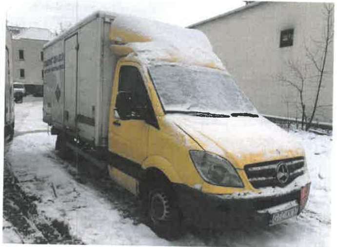
Fot. 2 IMG_4258