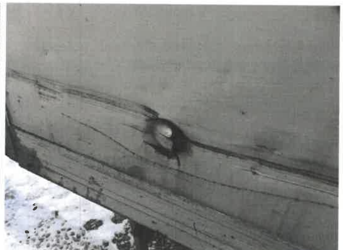
Fot. 16 IMG_4276