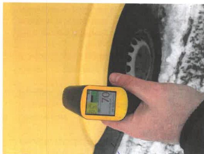
Fot. 22 IMG_4286