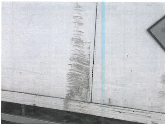
Fot. 9 IMG_4265