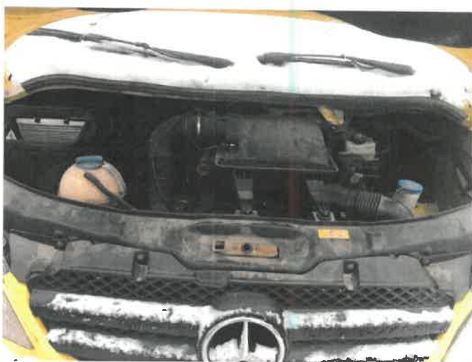
Fot. 19 IMG_4280