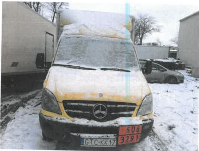
Fot. 3 IMG_4259