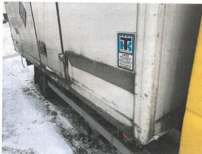
Fot. 18 IMG_4279