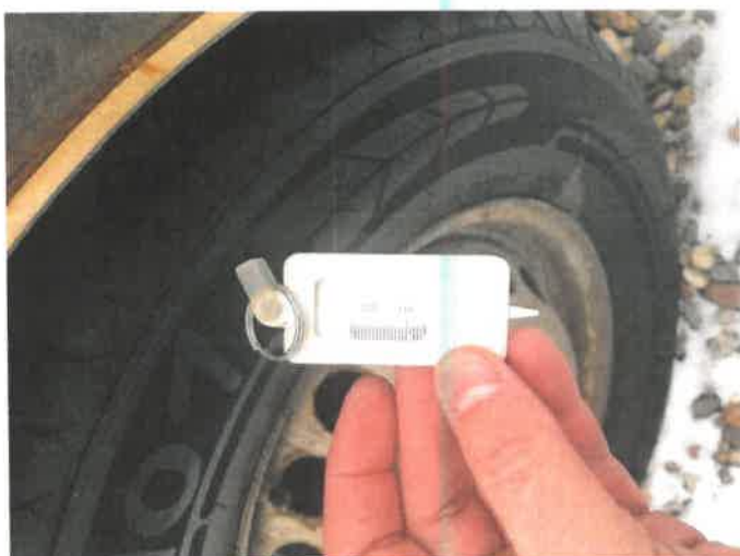
Fot. 27 IMG_4293

Biuro Rzecznictwa Samochodowego, Ruchu Drogowego, Wyceny Maszyn / Urzędzeń inż. Mirosław Kołomański 63-700 Starogard Gdański NIP: 6021030976