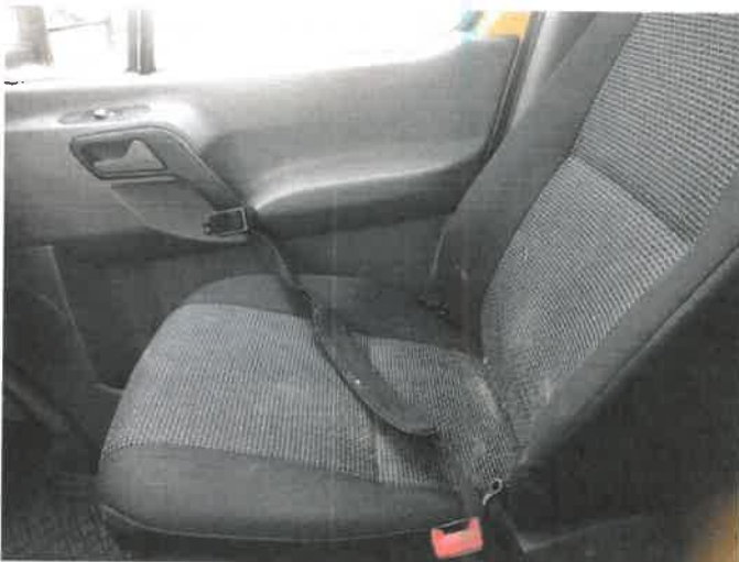
Fot. 15 IMG_4272