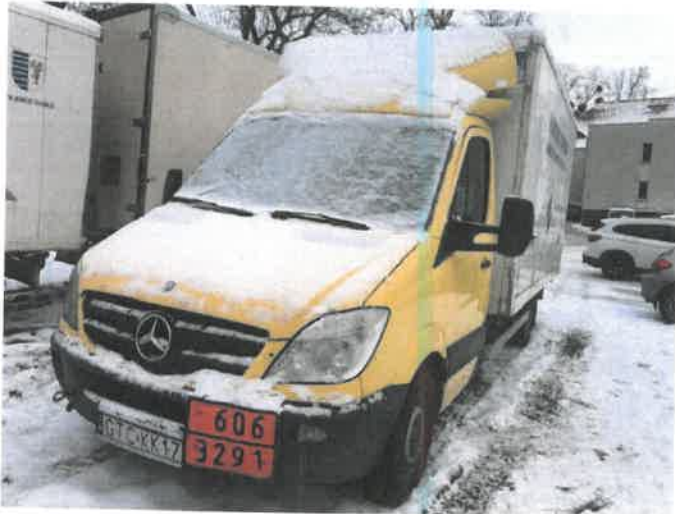
Fot. 1 IMG_4257