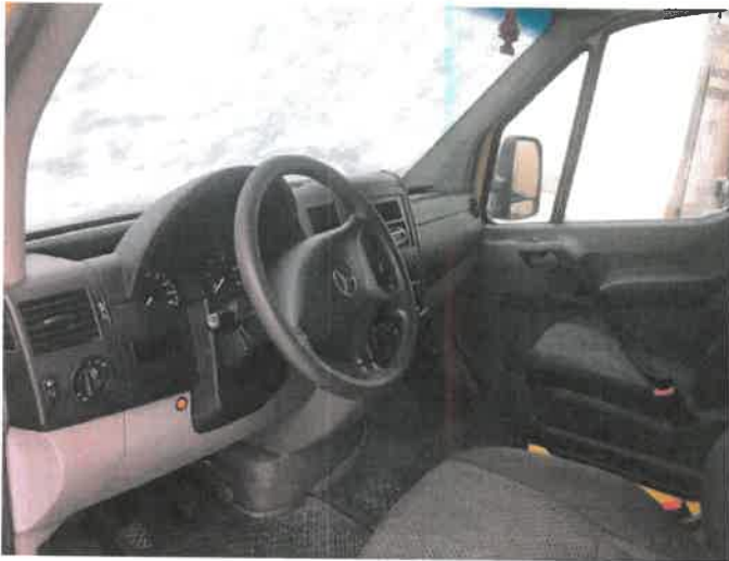
Fot. 11 IMG_4267