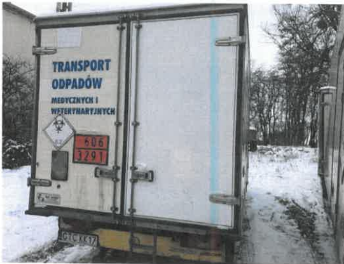
Fot. 5 IMG_4261