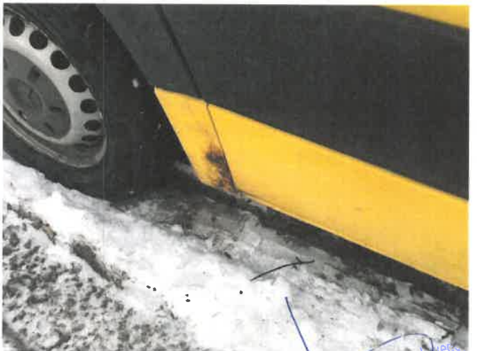
Fot. 10 IMG_4266