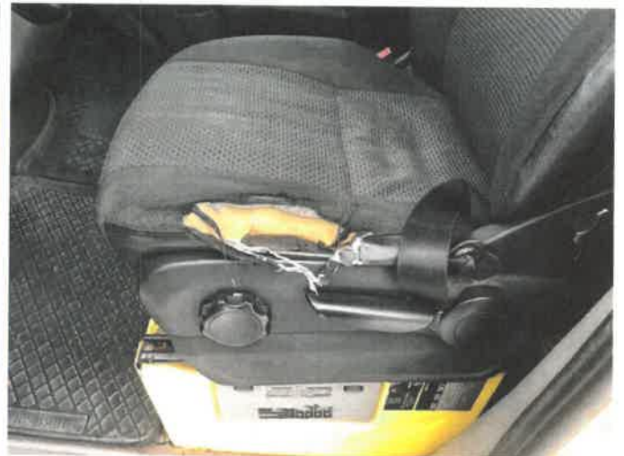
Fot. 14 IMG_4271