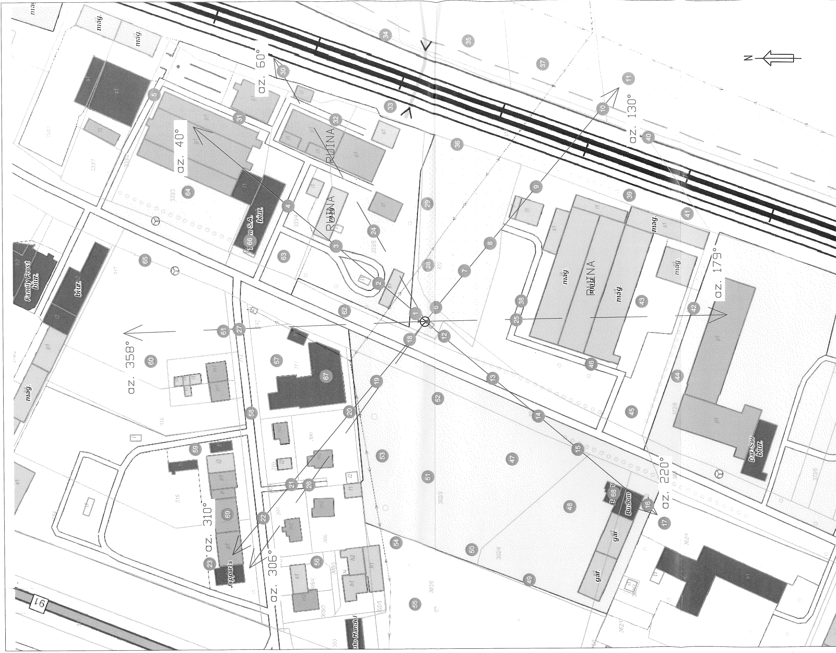
Rys.1 Lokalizacja pionów pomiarowych